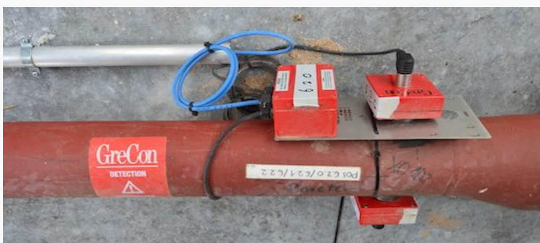
Détecteur d'étincelles GreCon sur un transporteur pneumatique de granulé