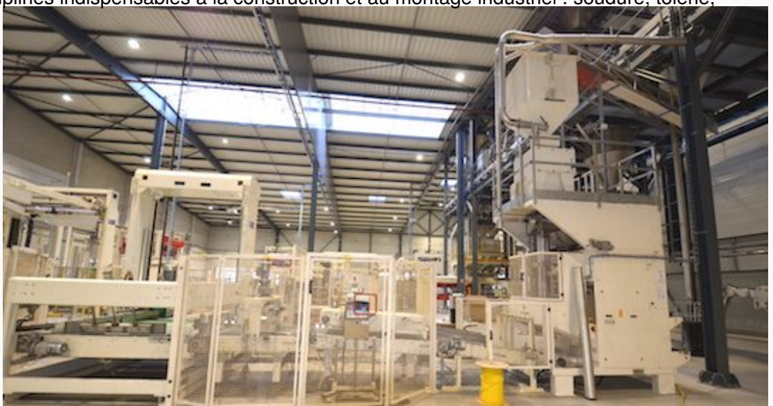
Le hall de conditionnement des produits finis

mécanique, hydraulique, électricité, mais aussi et surtout le dessin et son application. Avec tout cela, Antoine a enchaîné des expériences professionnelles peu banales chez plusieurs constructeurs d'équipements spéciaux et de véhicules professionnels en