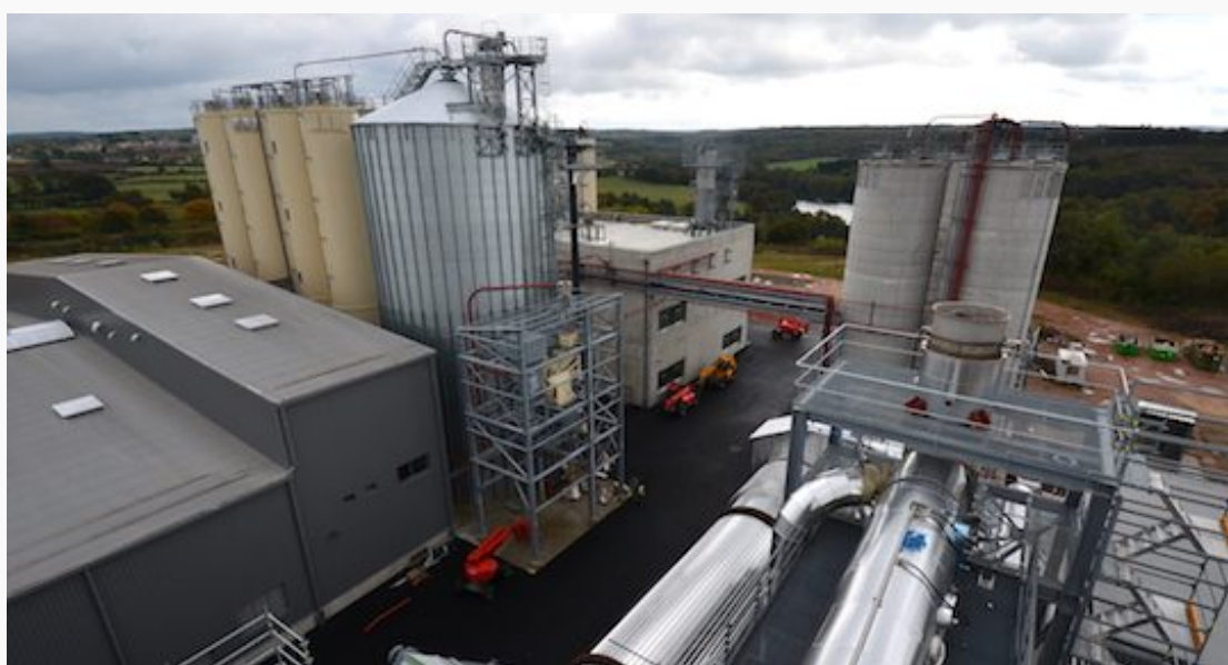
Vue sur les silos de Brenil Pellets et sur le hall de production au fond depuis la cheminée au dessus de l'électrofiltre