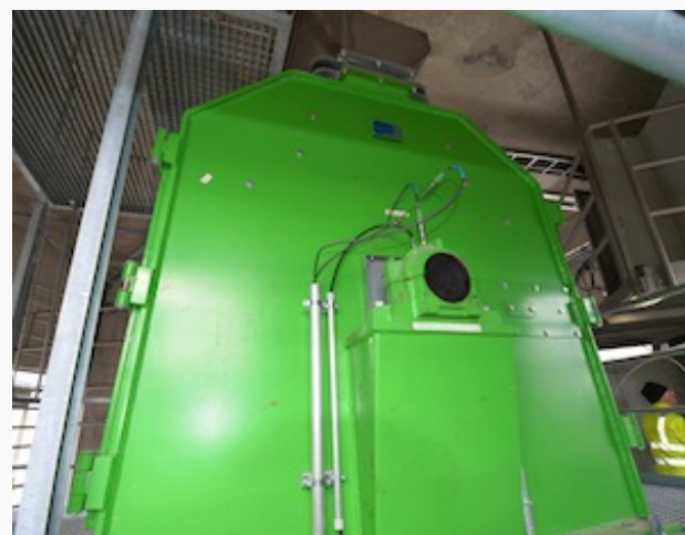
L'affineur de matière première sèche FRIEDLI

Dans le cas de Brenil Pellets, J&P a obtenu le marché pour le montage d'une bonne partie de l'installation des équipements mécaniques :