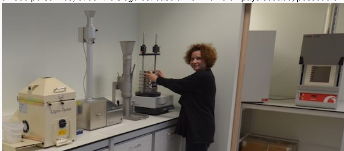
Le laboratoire de test sur les produits de Brenil Pellets

d'enrobé et 1 ha de bâtiments. Elle se compose d'une plateforme goudronnée pour la réception et le stockage