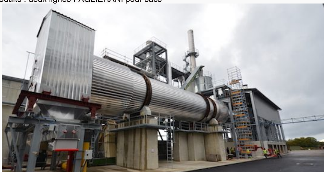
Le séchoir rotatif BUTTNER chez Brenil Pellets, photo Frédéric Douard