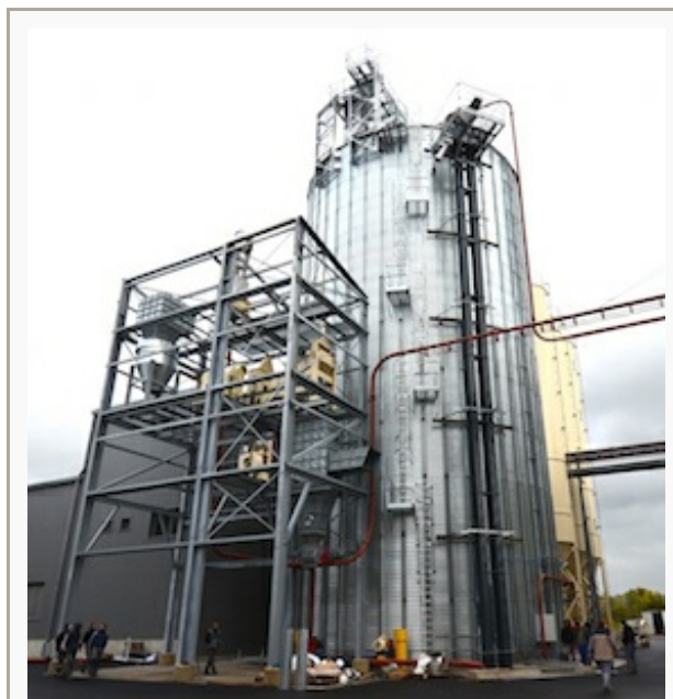
Le silo à granulés PHENIX ROUSIES et le poste de chargement des caïons pour le granulé en vrac en cour d'installation par Joly & Philippe, photo F. Douard

Frédéric Douard, en reportage à La Roche en Brenil