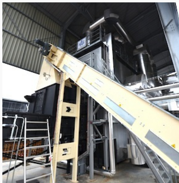
Le générateur d'air chaud VAS avec alimentation KNOBLINGER, photo Frédéric Douard