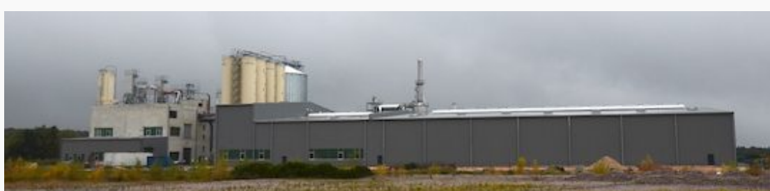
Vue de l'arrière de l'usine Brenil Pellets avec sur la droite le hall de stockage des produits palettisés