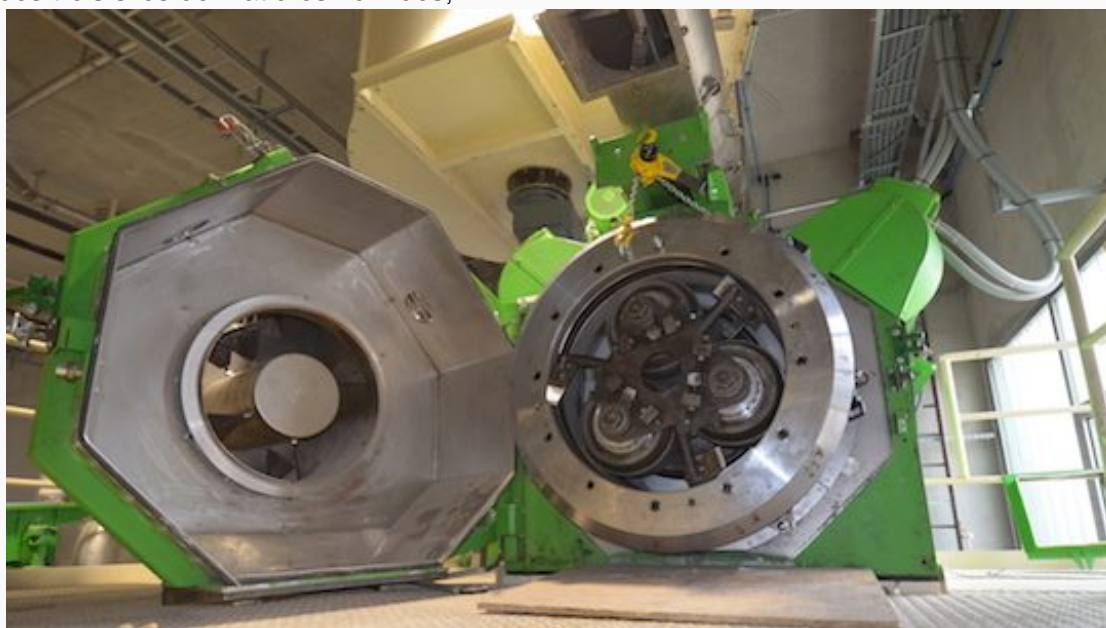
L'une des 3 presses SALMATEC

granulométrique, ainsi que de la chaufferie, avec du matériel KNOBLINGER,