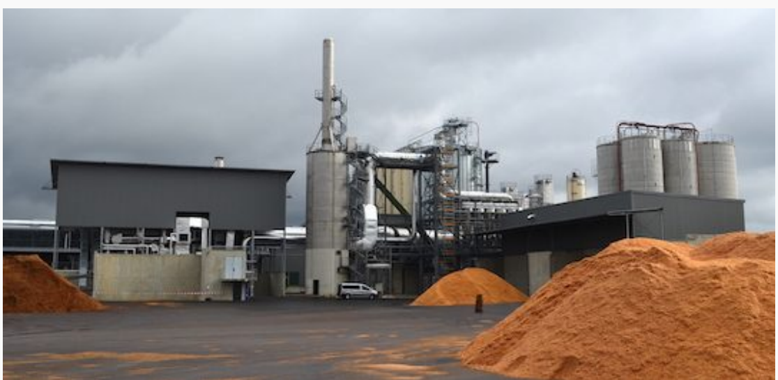
L'usine Brenil Pellets avec sa chaufferie à gauche et son électrofiltre en voie humide au centre sous la cheminée

L'entreprise a également acquis sa notoriété grâce à ses travaux de recherche sur le broyage, le fractionnement et l'affinage du bois. JRS apporte ainsi des solutions à base de fibres naturelles pour de multiples applications et processus dans les secteurs de la pharmacie ou de la cosmétique, de l'alimentation humaine, des applications techniques, industrielles et énergétiques (fibres ou gélifiants alimentaires, excipients pharmaceutiques,